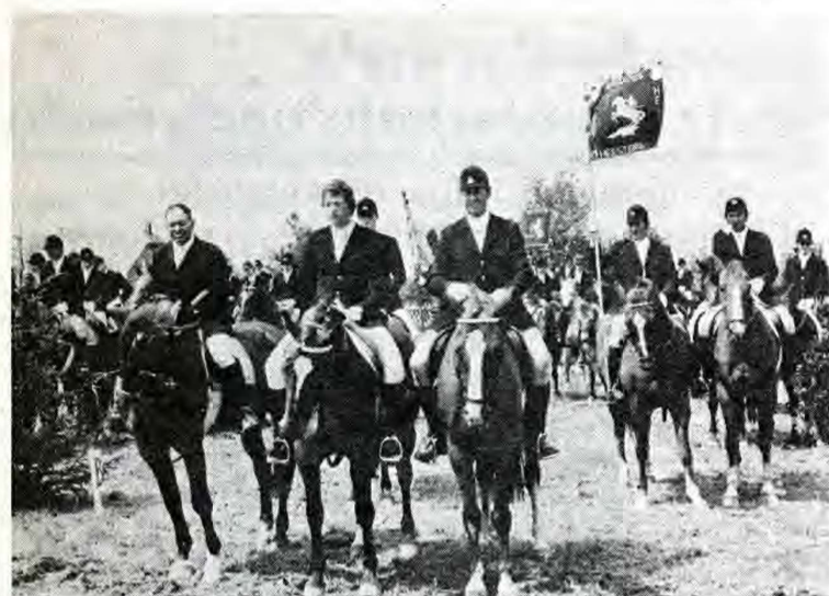
Das Defilee der Teilnehmer beim Reitturnier in Büllingen